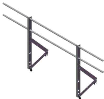
Ограждение кровли Optima 0,9 м без снегозадержателя