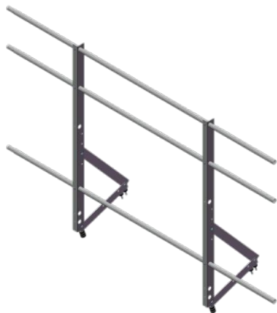
Ограждение кровли Optima 1,2 м без снегозадержателя