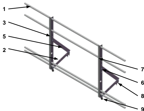
Ограждение кровли Optima 0,9 м со снегозадержателем